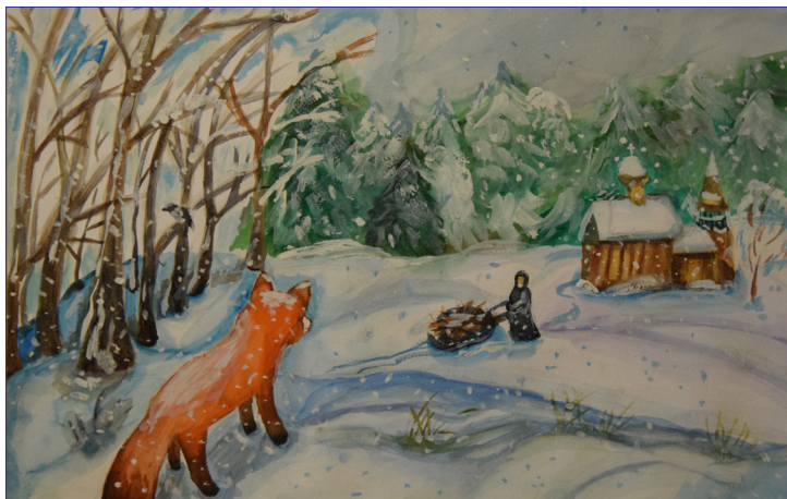
Галич Валерия, 13 лет, «В единении», 3 место