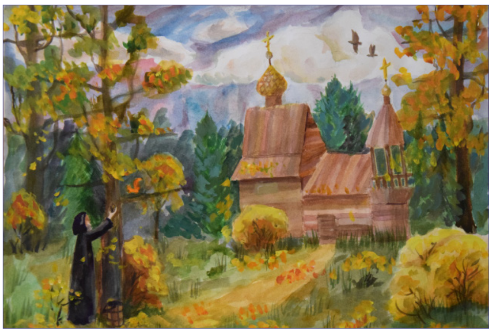
Сырцова Виктория, 14 лет, «Осень в обители», 2 место