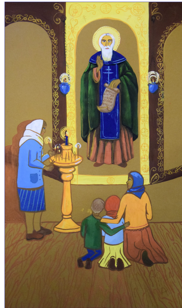
Емельянова София, 14 лет, «У иконы преподобного Сергия Радонежского», 2 место