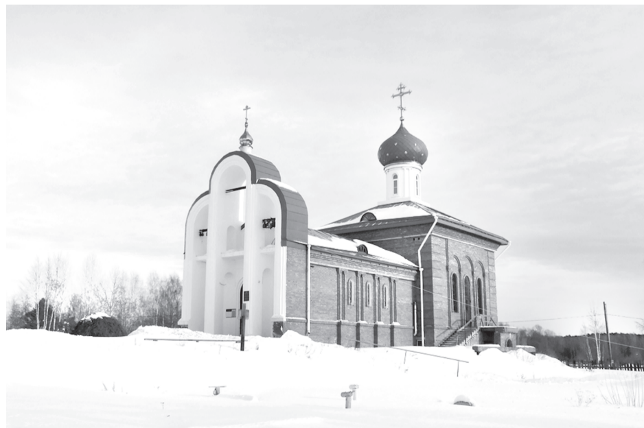
Сомда: Пермь саардагы Худай Ічезінің «Державная» иконазының адынаң тигіриб

Худай Ічезінің «Державная» иконазын таап алған күнде, - көрік айының 15-чү күнінде үлүкүннiri турғызыл парған.